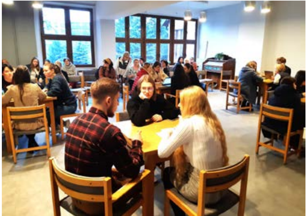
Forum dans les locaux de l'Église pour la recherche d'un emploi.

11 enfants du primaire et du secondaire ont commencé un cursus en polonais dans les locaux de l'église et sont maintenant admis dans les écoles publiques. Pour l'enseignement du